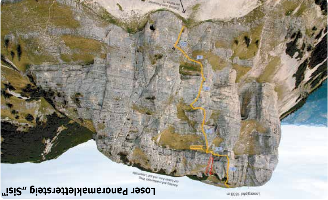
Loser Panoramaklettersteig „Sisi“