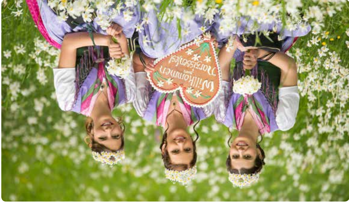
Ausseerland - Salzkammergut Lakes and Mountains: A pure pleasure.

Informationen: Tourismusverband Ausseerland – Salzkammergut 8990 Bad Aussee | Bahnhofstraße 132 Tel. +43 3622 54040 | Fax: +43 3622 54040-7 www.ausseerland.at | info@ausseerland.at