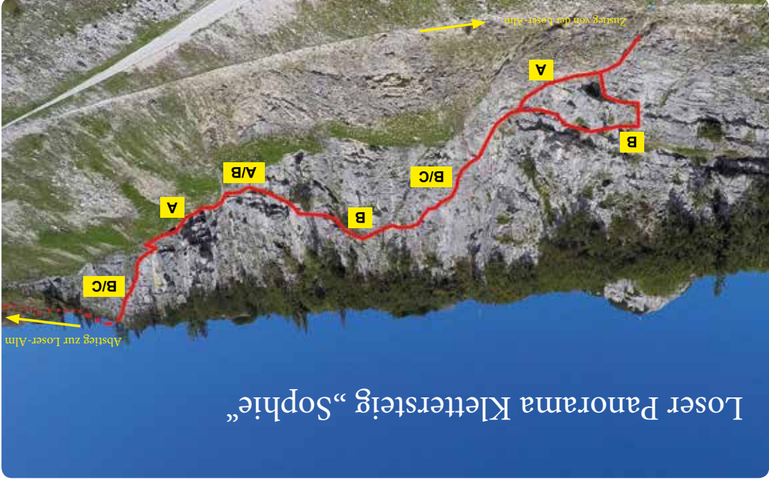
Loser Panorama Klettersteig „Sophie“